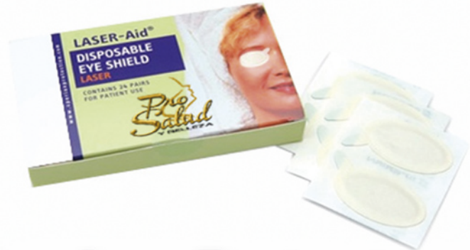
Parches Protectores Laser