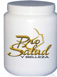
Galón de GEL (4lt.)