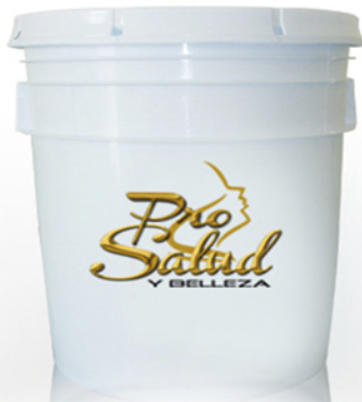
Cubeta de GEL (20lt.)